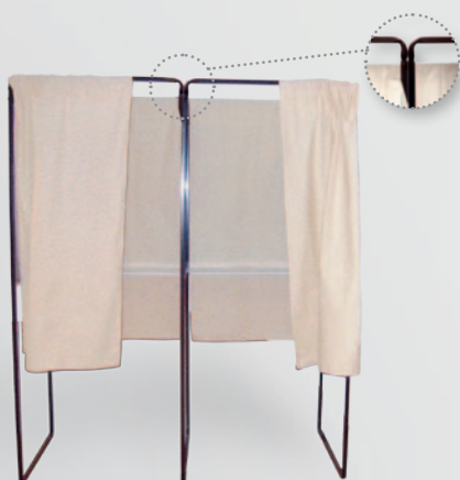
Isoloirs Initial + complémentaire Réf. 205101 / 205111

Les bureaux de vote doivent être équipés d'au moins un isolement permettant l'accès des personnes en fauteuils roulants (Code électoral art.D56-2)