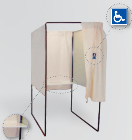
Isoloir Pour personnes à mobilité réduits Réf. 205122